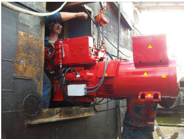
PK 215 Saint-Usage - Introduction du groupe électrogène babord en salle des machines