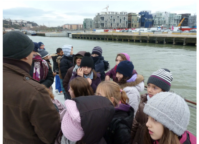
Edition 2010, découverte du nouveau quartier confluence

Alternant navigations et escales, cet itinéraire sera riche en découvertes, du monde macroscopique vivant au bord des cours d'eau au monde de la batellerie et à la vie des marinières. Les enfants auront également le plaisir de partager des moments de jeux collectifs, des temps d'échange et de partage en compagnie de leurs camarades et ce, tout en restant en contact avec cette nature qui les entoure. Ils reviendront riches de souvenirs en tête et grandis de cette expérience partagée au fil de l'eau.