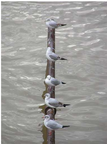
PK 4 - Lyon Quand la Saône sort de son lit, les mouettes « ricanent »