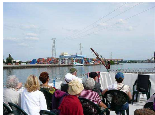
PK 1,5 Visite en péniche du port Edouard Herriot

Ce programme d'actions éducatives et culturelles est soutenu et s'inscrit dans le cadre du Plan d'Education au Développement Durable du Grand Lyon et du 9ème programme de l'Agence de l'Eau Rhône Méditerranée Corse.