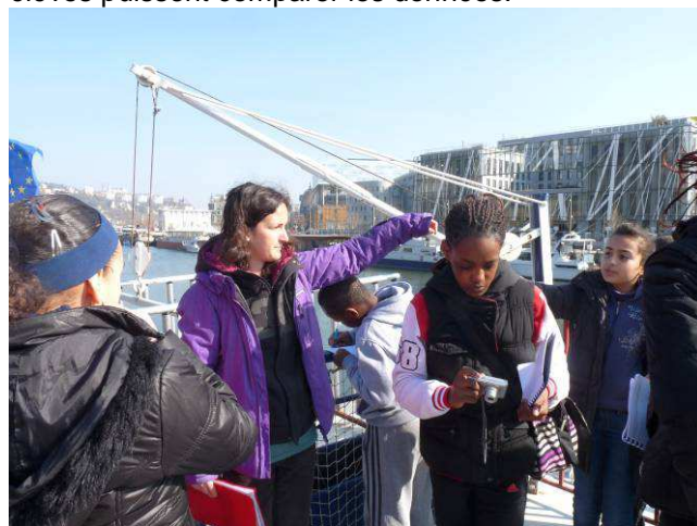
Pk1 – La Confluence, découverte des aménagements

La prochaine journée de navigation est prévue, cette fois-ci, sur le Rhône au mois de mai afin que les élèves puissent comparer les données.