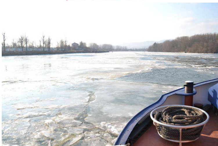
PK27 – Parcieux février 2012, la Vorgine brise la glace !